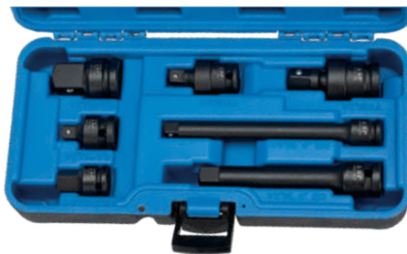
7-PC IMPACT ACCESSORY KIT / JEU DE 7 ACCESSOIRES POUR DOUILLES À CHOCS