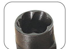
10-PC 1/2" DR SAE/METRIC TWIST IMPACT SOCKET SET - 6 PT / JEU DE 10 DOUILLES À CHOCS TORSADÉES SAE/MÉTRIQUES À PRISE DE 1/2 PO - 6 PANS