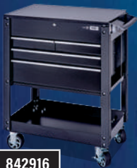
HEAVY DUTY 4-DRAWER SERVICE CART - 30" x 19" / CHARIOT DE SERVICE ROBUSTE À 4 TIROIRS - 30 PO x 19 PO