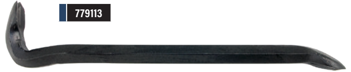
11" NAIL PULLER BAR / BARRE ARRACHE-CLOU DE 11 PO