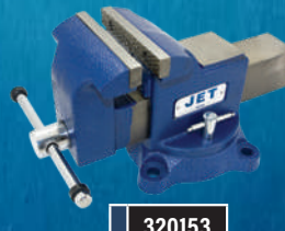
HEAVY DUTY SWIVEL BASE VISES / ÉTAUX À BASE PIVOTANTE ROBUSTE