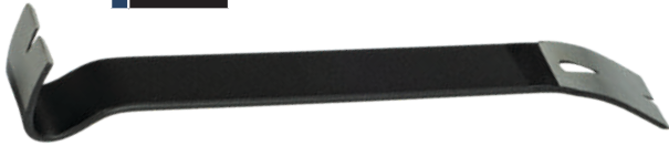
15" UTILITY BAR / BARRE UTILITAIRE DE 15 PO